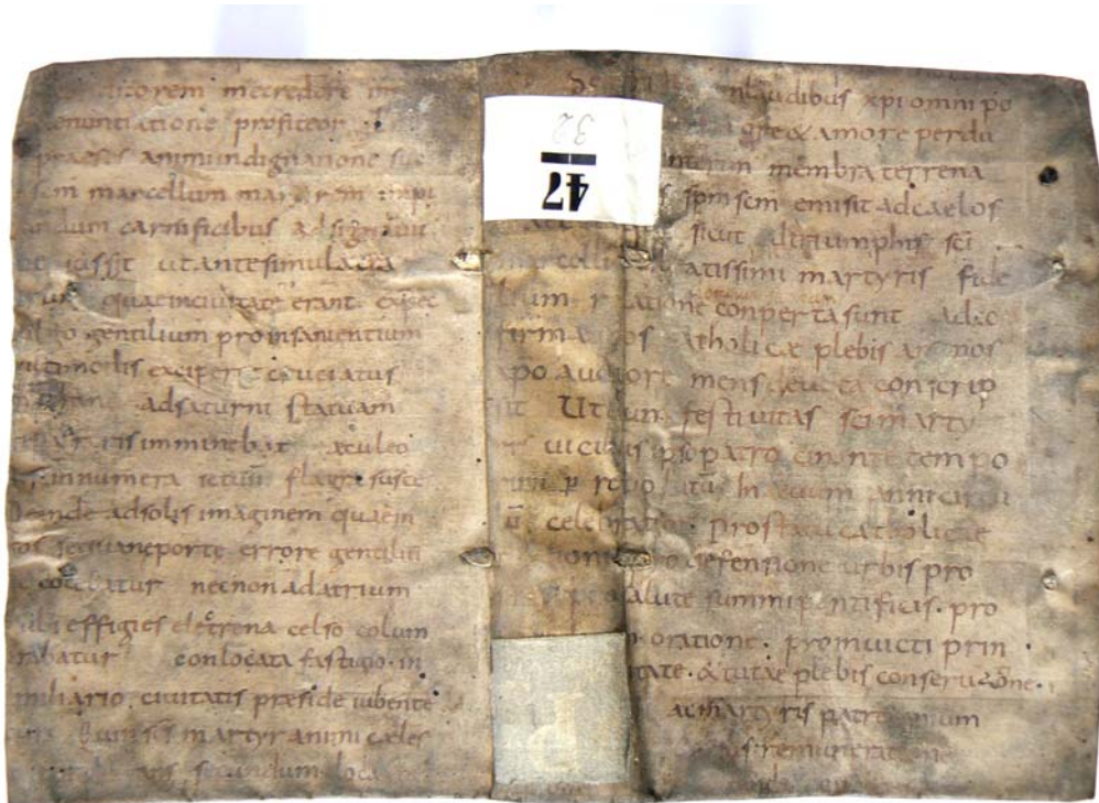
Nejstarší z druhotně užitých rukopisných zlomků (9. stol.).