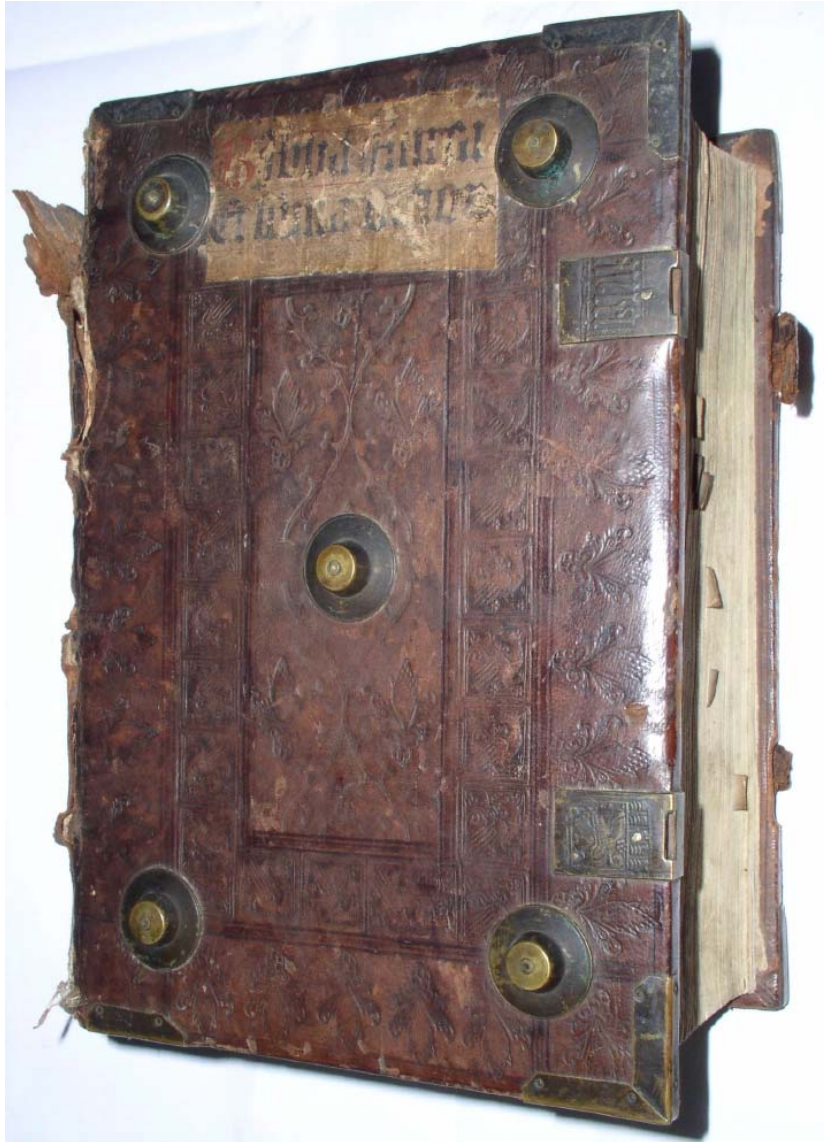
Dílno „Vogel verziert - Fuchsvogel-Meister II“, Augsburg - celokožená gotická vazba (ne před 1476).