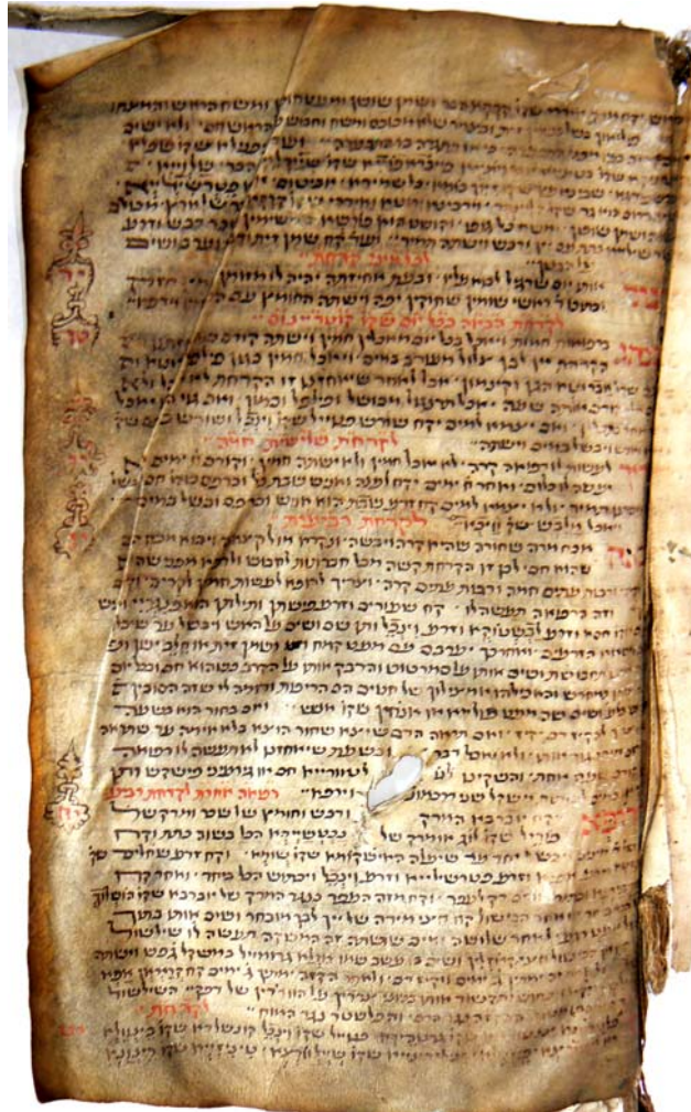
Zlomek středověkého hebrejského lékařského rukopisu (před 1500).